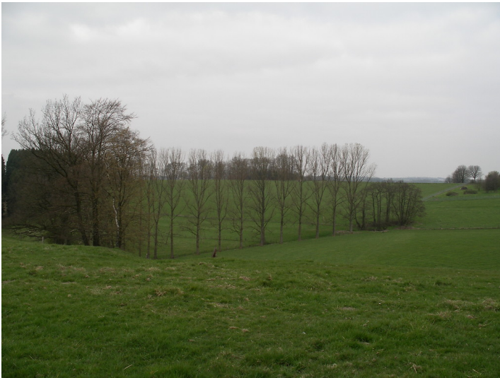
Pappelreihe bei Westhofen (2007)