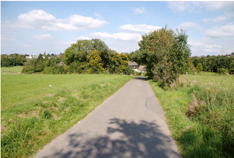
Junkernbusch (2008)