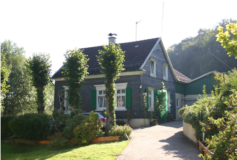
Wohnhaus mit Hausbäumen in Niederhagelsiepen (2007)