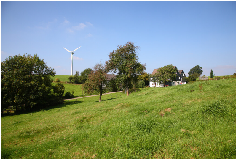
Blick auf den Einzelhof Niederbeck (2008)