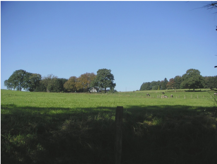
Blick auf Altenhof (2007)