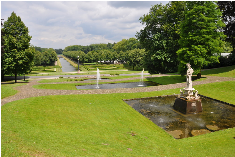
Wasserbecken und Sichtachse, Historische Parkanlage Kleve (2012)