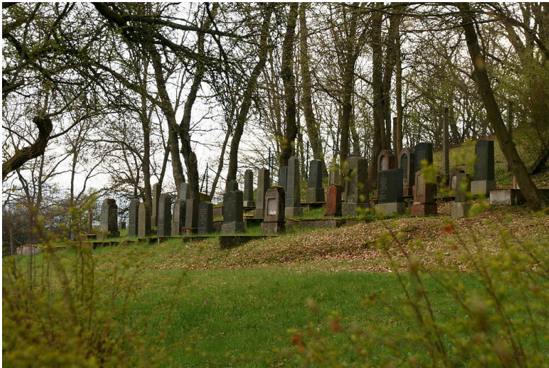
Der jüdische Friedhof Mühlweg in Bad Schwalbach / Langenschwalbach (2012).