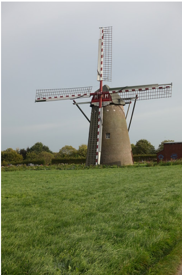
Windmühle Waldfeucht (2017)