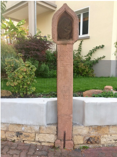
Gesamtansicht des Bildstocks im Immengarten (2017).